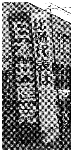
「比例代表は日本共産党」のぼりで宣伝活動