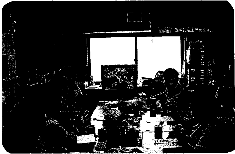
茶房「大五郎」 健康チェック風景